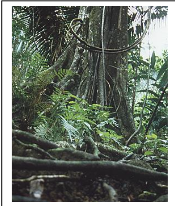
Abbildung: Baumriesen wie dieser müssen den Gärten weichen.

Die einzige Möglichkeit, die Belastung des Flusssystems auf ein erträgliches Maß zu reduzieren, wäre der Bau eines Rückhaltedammes für Abraum und Erzabfälle. Mit Hinweis auf die Kosten von umgerechnet einer halben Million Euro hat die Minengesellschaft den Bau des Dammes verweigert. Die vorhersehbaren Gewinne aus der gesamten Laufzeit der Mine liegen allerdings bei sechs Milliarden Euro.